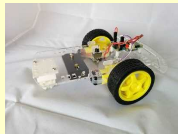
スマート・ロボットカー